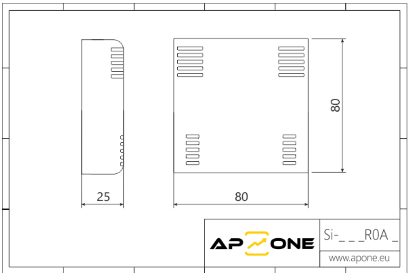
Rysunek techniczny SiOne

Wymiary znajdujące się na rysunku są orientacyjne.